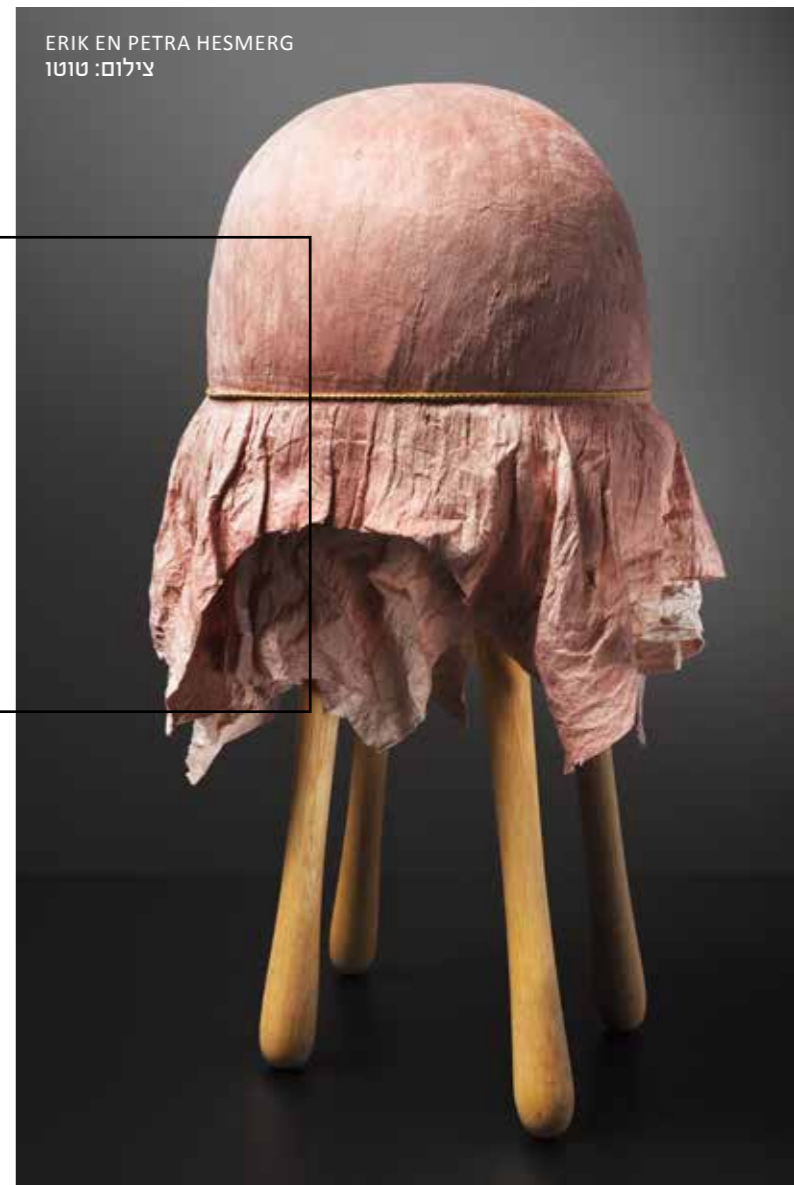
ERIK EN PETRA HESMERG