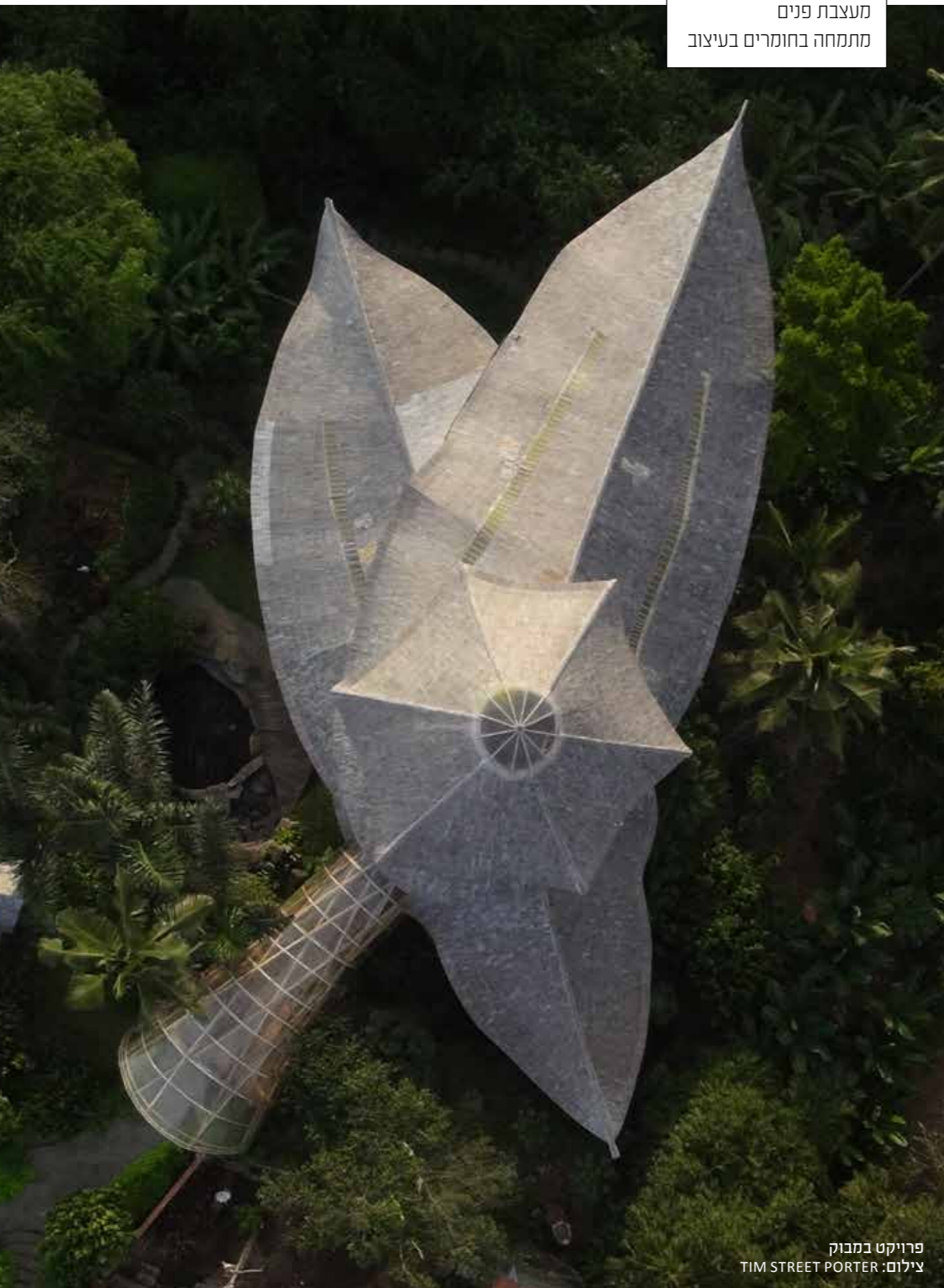
פרויקט במבוק