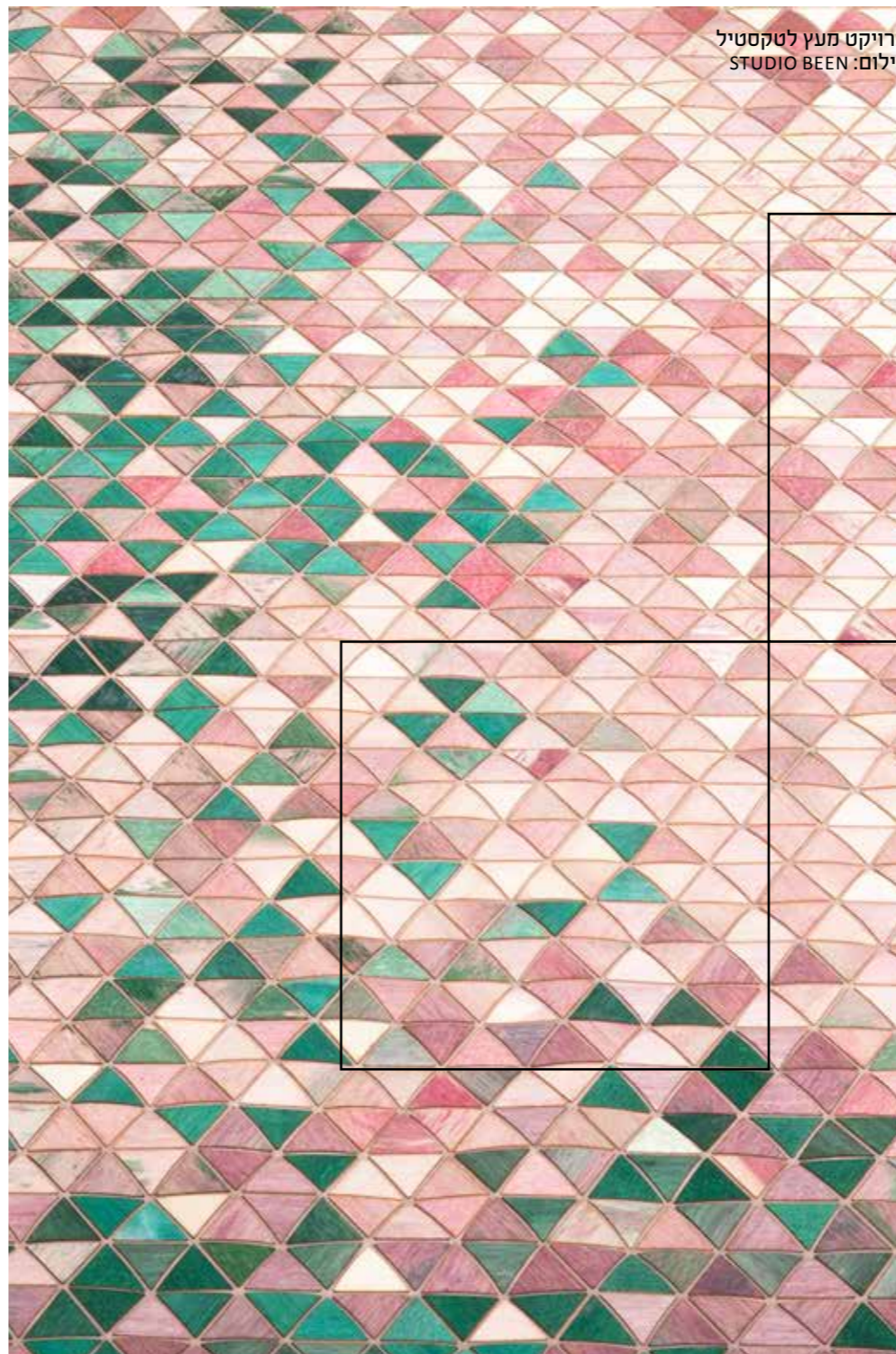
פרויקט מעץ לטקסטיל