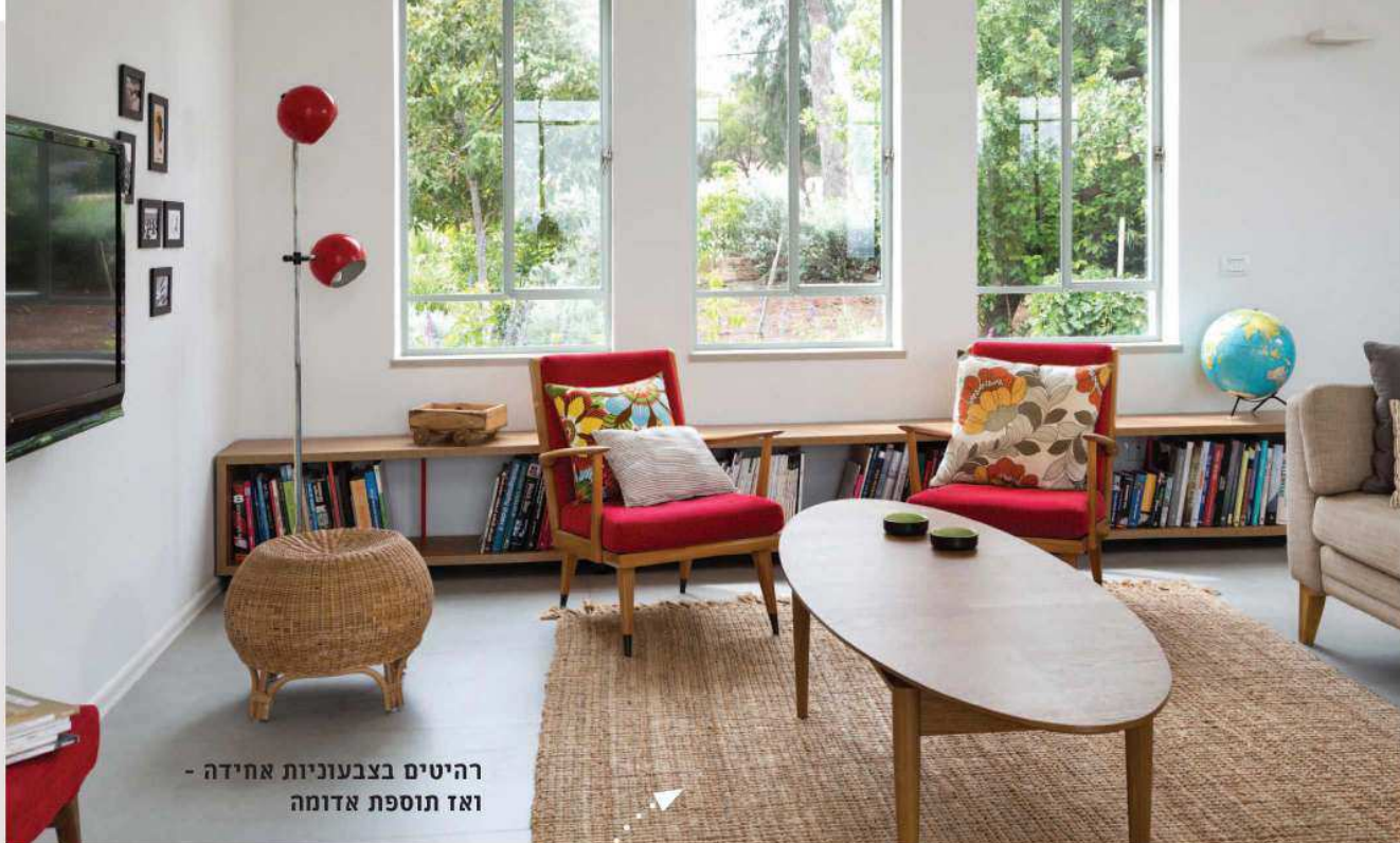
רהיטים בצבעוניות אחידה - ואז תוספת אדומה