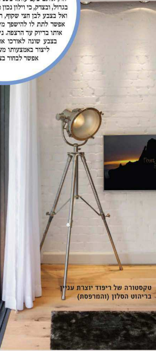
טקסטורה של ריפוד יוצרת עניין בריהוט הסלון (והמרפסת)

כדאי להוסיף כורסה אחת או יותר שיהיו שונות מהספה המרכזית בצבע, במרקם או במבנה. כך יישבר מראה ה"סט", והסלון כולו יעניין יותר. זו יכולה להיות כורסה עתיקה מבית סבתא, כורסת רטרו מהשוק שתרופר מחדש, או כורסה שנקנתה יחד עם הספה ורופדה בכד שונה. כדי שהספה תתאים לכורסאות, מומלץ לפזר עליה כריות שיהיה להן קשר לרהיטים האחרים. אל תחששו מכריות בצורות גיאומטריות, במרקמים ובצבעים בולטים כמו צהוב וטורקיז. זה מקפיץ את הסלון.