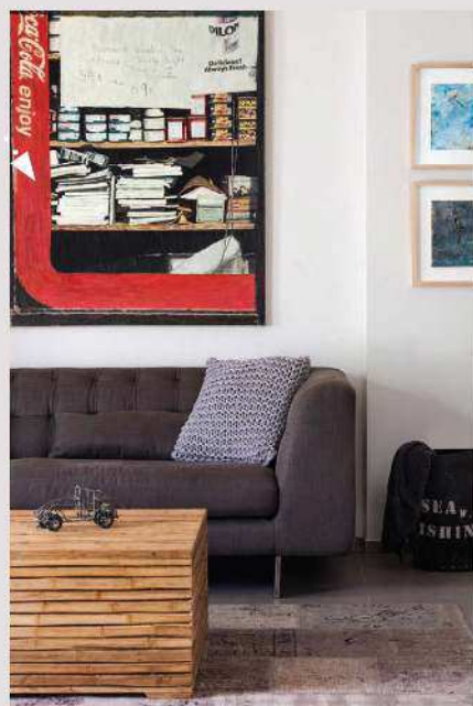
עיצוב פנים: שרון אלה