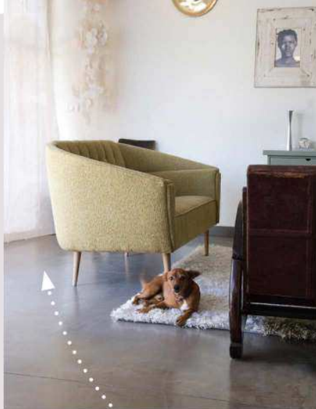
עיצוב פנים: שרון אלה, צילומים: גלית דויטש ושי אפשטיין