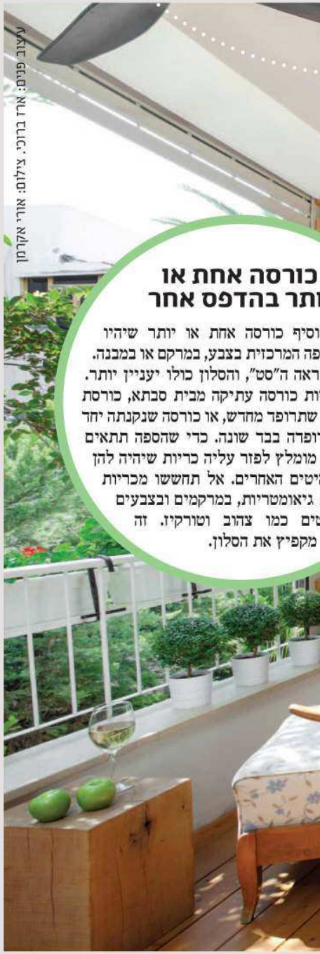
עיצוב פנים: אור ברנכי

היו תקופות שהווילונות הארוכים והנ"שפכים בסלון ננטשו, אולי לאות מחאה על סלוני ילדותנו (או שמא בגלל הצורך המעיק לת"חוק אותם בקביעות). בשנים האחרונות הווילון חזר בגדול, ובצדק, כי וילון נכון מוסיף המון. אם תבחרו בד ואל בצבע לבן חצי שקוף, רוב הסיכויים שלא תטעו. אפשר לתת לו להישפך מעט על הרצפה או לקצר אותו בדיוק עד הרצפה. ניתן גם לתת לו הרגשה בצבע שונה לאורכו או לרוחבו. אם רוצים ליצור באמצעותו מעין מסגרת לחלון, אפשר לבחור בצבע כהה.