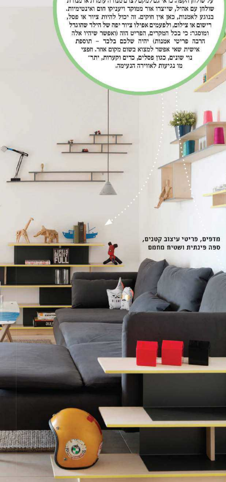
מדפים, פריטי עיצוב קטנים, ספה פינתית ושטיח מחמם

זה הטאץ' האחרון שיכול לשקף את אישיותכם ולהוסיף צבע ותוכן. ספרים הם פריט מושלם ומושלם לכל חלל, ובי וודאי לסלון. אפשר להציב אותם בספרייה, בנישה ייעודית או על שולחן הקפה. כדאי גם למקם לצדם מגורה עומדת או מגורה שולחן עם אחיל, שייצרו אור ממוקד ויעניקו חום ואינטימיות. בנוגע לאמנות, כאן אין חוקים. זה יכול להיות ציור או פסל, רישום או צילום, ולפעמים אפילו ציור יפה של הילד שהוגדל ומוסגר: כי בכל המקרים, הפריט הזה (ואפשר שיהיו אלה הרבה פריטי אמנות) יהיה שלכם בלבד – תוספת אישית שאי אפשר למצוא בשום מקום אחר. חפצי נוי שונים, כגון פסלים, כדים וקערות, יתרי מו נגיעות לאווירה הנעימה.